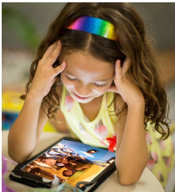
Atelier : À quoi penses-tu ?