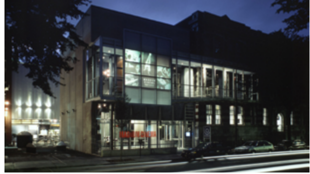
Intervenir aujourd'hui sur le bâti existant : rupture, contraste ou continuité ?