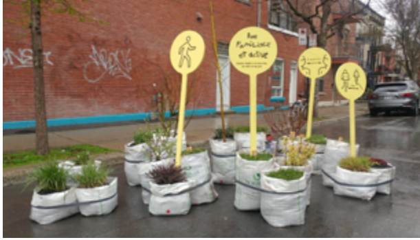
Aménagement et santé publique : la rue, le quartier, la métropole