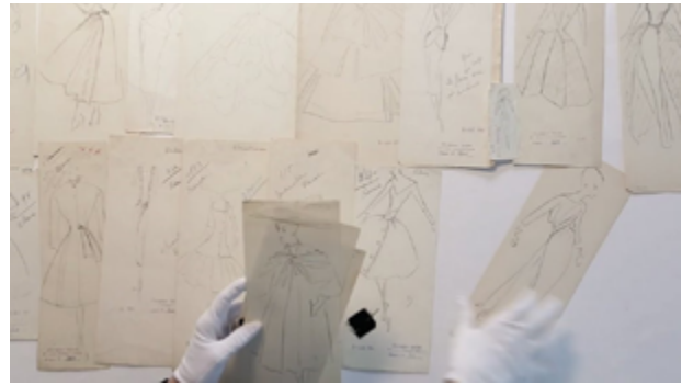
Les dessins de Christian Dior , 2017, Loïc Prigent.