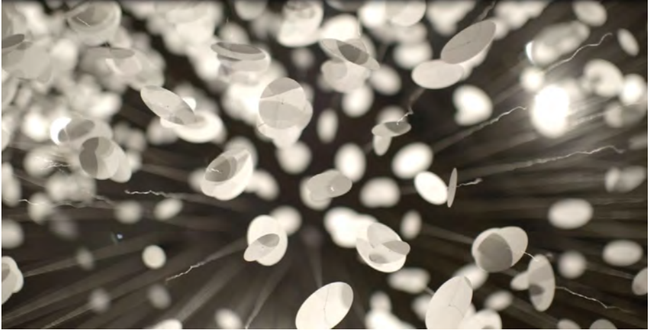
© 汉娜·克劳斯 (Hannah Claus), 飞扬 ( L'envolée ), 2013年

博物馆的驻馆艺术家项目迎来了莫霍克族 (kanien'kehà:ka/mohawk) 的视觉艺术家, 汉娜·克劳斯 (Hannah Claus)。她的装置艺术让参观者沉浸在唤起记忆与蜕变的感性世界。