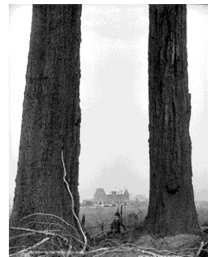
Wm Notman & Son/William McFarlane Notman Pins Douglas, Vancouver, C.-B., 1887 © Musée McCord

Sa gestion très moderne et son sens aigu des communications le font connaître partout. Véritable entrepreneur, il gère ses affaires de main de maître et son réseau compte, en 1872, jusqu'à vingt-six studios franchisés