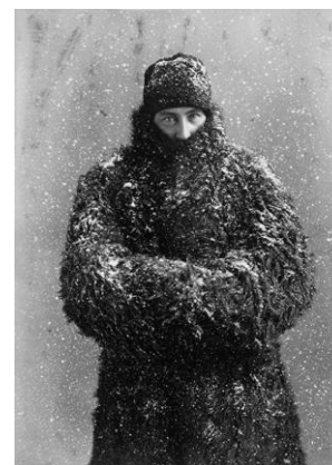
Wm. Notman & Son, A. H. Buxton, Montréal, 1887 ©Musée McCord