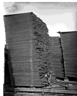
William Notman Pile de bois d'œuvre, Ottawa, ON, 1872