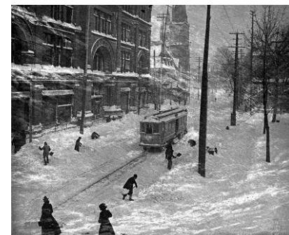
William Notman & Son/William Hagerty Journée de tempête, rue Sainte-Catherine, Montréal, 1901 © Musée McCord