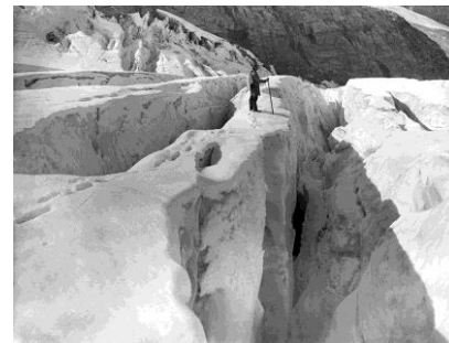
Wm Notman & Son/William McFarlane Notman Glacier Asulkan, parc des Glaciers, C.-B., 1889 © Musée McCord

Le Musée McCord se consacre à la préservation, à l'étude et à la mise en valeur de l'histoire sociale de Montréal d'hier et d'aujourd'hui, de ses gens, de ses artisans et des communautés qui la composent. Il abrite l'une des plus importantes collections historiques en Amérique du Nord, composée d'objets des Premiers Peuples, de costumes et de textiles, de photographies, d'arts décoratifs, de peintures et d'estampes, et d'archives