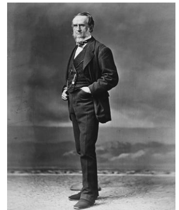
William Notman Montréal, 1875