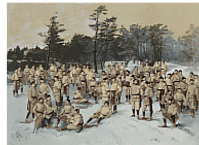
Le Red Cap Snow Shoe Club, Halifax, N.-É., 1888 William Notman/Eugène L'Africain © Musée McCord

La collection Notman est l'une des plus importantes collections de ce genre au Canada. Elle contient les archives photographiques du studio de Montréal, qui réunissent environ 450 000 photographies, dont 200 000 négatifs sur plaques de verre, des portraits, des paysages et des vues stéréoscopiques d'une valeur historique inestimable. La collection Notman renferme également 188 registres de photographies et 43 répertoires des clients du studio de Montréal, ainsi que 15 ouvrages publiés par William Notman, quelque 300 photos peintes, des photos composites, du matériel photographique et des documents, dont la correspondance de Notman avec sa famille demeurée en Écosse. Cette collection s'enrichit constamment grâce aux dons de particuliers, familles et collectionneurs, et constitue pour les chercheurs et les historiens une source inépuisable sur l'histoire de Montréal, de 1859 à 1935.