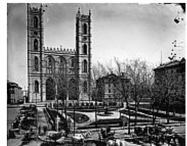
La place d'Armes et l'église Notre- Dame, Montréal, 1876