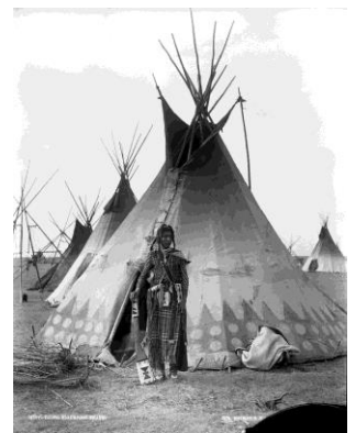
Jeune guerrier niisitapiikwan, près de Calgary, Alb., 1889