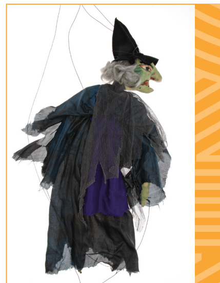
MARIONNETTE, SORCIÈRE 1960-1968, M988.181.1.10