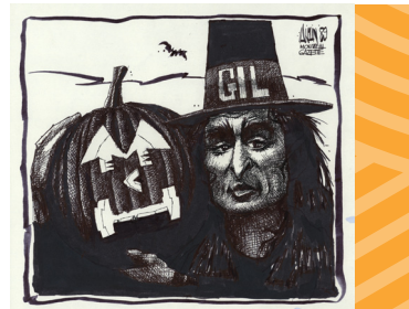
LE COSTUME D'HALLOWEEN DE GIL RÉMILLARD AISLIN 31 OCTOBRE 1989 M989.397.40

La citrouille est récoltée à l'automne juste avant le gel, ce qui coïncide avec la fête de l'Halloween, le 31 octobre. Si vous souhaitez accueillir des petits monstres à votre porte, il faut décorer votre citrouille. Voici quelques conseils pour faire une belle citrouille d'Halloween 1 .