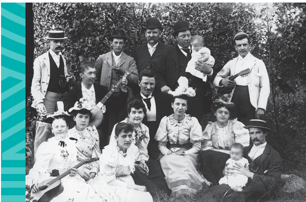
PHOTOGRAPHIE GROUPE DE PERSONNES AVEC DES INSTRUMENTS DE MUSIQUE DRUMMONDVILLE, QC, VERS 1895