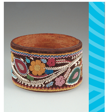
RÉCIPIENT, 1865-1900 M196