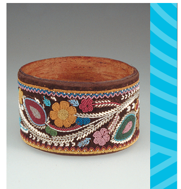
RÉCIPENT, 1865-1900 M196

Les échanges commerciaux entraînent aussi des échanges culturelles, qui mettent les Mi'kmaq en relation avec les Euro-Canadiens et les autres nations autochtones de l'ouest, des Hurons-Wendats de Lorette aux Iroquois des Six-Nations.