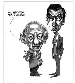
OK, tout le monde prend un valium! Montreal Gazette , 16 novembre 1976 Don de Terry Mosher, P090-A/50-1004 © Musée McCord