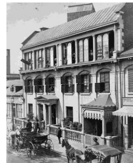
William Notman ou Notman & Sandham Studio de William Notman, 17, rue Bleury, Montréal, vers 1875 Négatif sur verre inversé

Dans le cadre des festivités entourant le 375 e anniversaire de Montréal et le 150 e anniversaire de la Confédération canadienne, le Musée McCord présente une grande exposition thématique sur la vie et l'œuvre de ce Montréalais d'origine écossaise, le plus grand photographe canadien du 19 e siècle et pionnier de la photographie au Canada. Proposant un point de vue renouvelé sur la carrière de William Notman (1826-1891), cette présentation s'articule autour des aspects étonnamment modernes de la personnalité de l'artiste qui ont contribué à son immense succès. Elle met en lumière son approche moderne de la photographie, fondée sur les principes de la communication, de la gestion et de l'innovation. Si les épreuves d'époque sont au cœur de l'exposition, diverses installations en nouvelles technologies complètent également l'expérience du visiteur. L'exposition réunit près de 300 photographies et objets puisés essentiellement dans la collection du Musée. Produite, organisée et mise en circulation par le Musée McCord, l'exposition sera présentée ultérieurement au Musée canadien de l'histoire, à Gatineau, et au Glenbow Museum, à Calgary. Elle a fait l'objet d'un important ouvrage de 240 pages publié par le Musée McCord. La tournée de l'exposition a été rendue possible [en partie] grâce au gouvernement du Canada et à la Fondation Molson. Le Fonds Standard Life – Notman octroie du financement annuel pour la conservation et la diffusion de la Collection Notman.