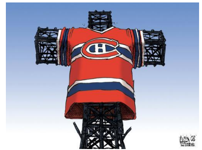
Aislin, Croix du Mont Royal , The Gazette , 13 mars 2008. Don de Terry Mosher

Ce projet a été conçu, produit et réalisé par le Musée McCord, en collaboration avec la Société des célébrations du 375 e anniversaire de Montréal.