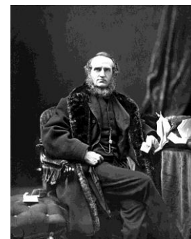
William Notman, Montréal, QC, 1868 Photographie William Notman (1826-1891) 1868, 19 e siècle I-30283