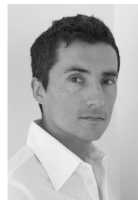
Kent Monkman