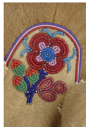
Mocassins (détail) 1900-1940 Déné ou Métis, ME976X.63.1-2