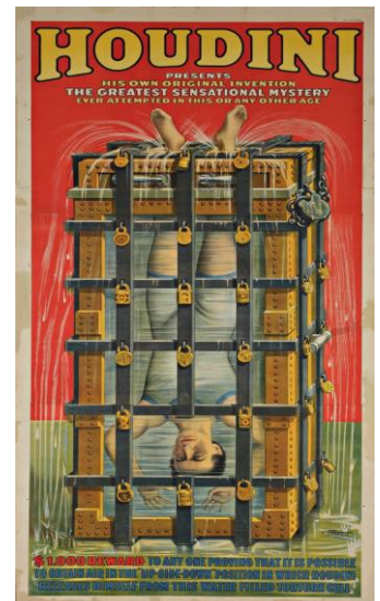
Houdini Presents His Own Original Invention The Greatest Sensational Mystery Ever Attempted in This or Any Other Age The Strobridge Litho. Co., 1916 213 x 102 cm