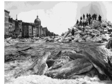
Wm Notman & Son Embâcle, rue des Commissaires, Montréal, vers 1884 Négatif sur verre inversé