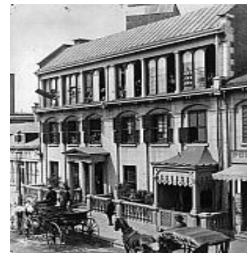
William Notman ou Notman & Sandham Studio de William Notman, 17, rue Bleury, Montréal, vers 1875 © Musée McCord

présente Notman, photographe visionnaire , une grande exposition thématique sur la vie et l'œuvre de ce Montréalais, le premier photographe canadien à atteindre une réputation internationale et pionnier de la photographie au Canada au 19 e siècle. L'ensemble de son œuvre, avec ses paysages d'est en ouest et ses portraits, a contribué à construire l'identité nationale canadienne. L'exposition réunit près de 300 photographies et objets puisés essentiellement dans la collection du Musée McCord. Proposant un point de vue renouvelé sur la carrière de William Notman (1826-1891), cette présentation s'articule autour des aspects de la personnalité de l'artiste qui ont contribué à son immense succès. Elle met en lumière son approche moderne de la photographie, fondée sur les principes de la communication, de la gestion et de l'innovation. Si les épreuves d'époque sont au cœur de l'exposition, des installations multimédias et des dispositifs interactifs s'y greffent pour offrir à un public contemporain une information dynamique permettant de mieux saisir la notion de modernité au 19 e siècle. L'exposition Notman, photographe visionnaire est organisée et mise en circulation par le Musée McCord.