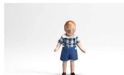
Poupée 1930-1940