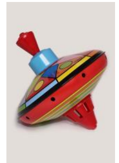
Toupie de Moulin Roty