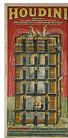
Houdini La cage vitrée remplie d'eau Strobridge Lithographing Co., 1916