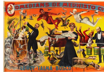
Le Roy, Talma, Bosco Les monarques de la magie Adolph Friedländer, 1905 M2014.128.318

L'exposition convie le visiteur à un spectacle de magie mettant en vedette les plus grands magiciens de l'âge d'or. Chaque section de l'exposition explore un type particulier d'illusion : apparition et disparition, décapitation, lévitation, évasion et mentalisme. Le public est en même temps invité à interpréter ces affiches à travers des thèmes tels que le spiritualisme, l'orientalisme, la transmission du savoir et le rôle des femmes dans le monde de la magie. Pour rendre tangible l'intangible, trois courtes vidéos de magiciens en train d'exécuter