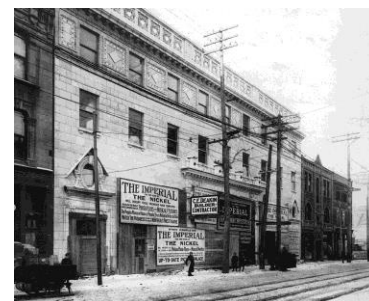
Théâtre Impérial, rue De Bleury, Montréal, 1913 (détail)