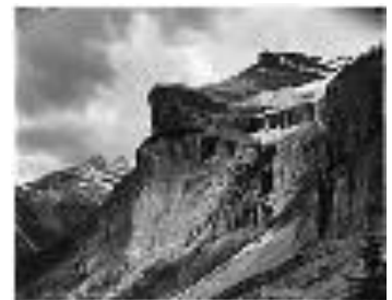
Emerald Peak et cascade, C.-B., 1904