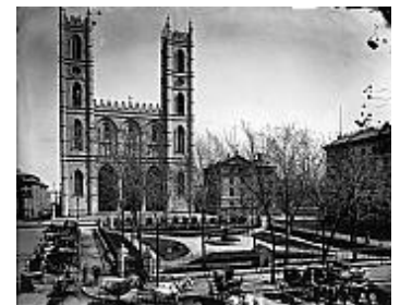
La place d'Armes et l'église Notre- Dame, Montréal, 1876