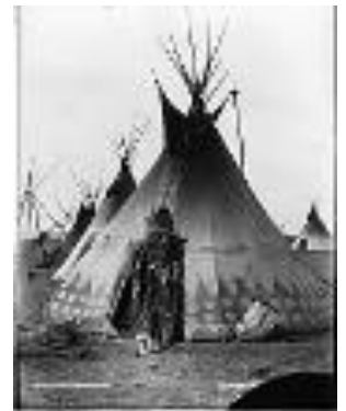
Jeune guerrier niisitapiikwan, près de Calgary, Alb., 1889