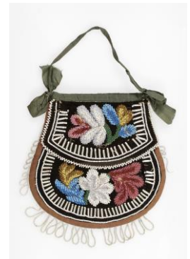
Bourse 1840-1900 Haudenosaunee, possiblement Kanien'kehá:ka