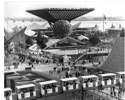
Vue du pavillon du Canada, Expo 67 1967

■ La deuxième thématique du camp, Abracadabra! , transportera les jeunes participants dans un univers où réalité et illusions se confondent. Guidés par les conseils d'un magicien professionnel et accompagnés par l'équipe d'animateurs du camp, les jeunes apprivoiseront quelques tours de magie qu'ils reproduiront fièrement lors d'un spectacle au Musée McCord auquel parents et amis seront conviés. Pour l'occasion, ils réaliseront une affiche promotionnelle pour leur spectacle de magie en s'inspirant de celles