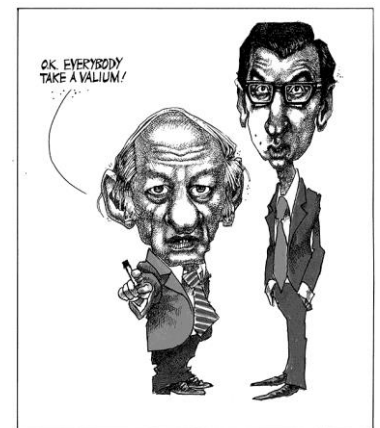
OK, tout le monde prend un valium! Montreal Gazette , 16 novembre 1976. Don de Terry Mosher, P090-A/50-1004 © Musée McCord.