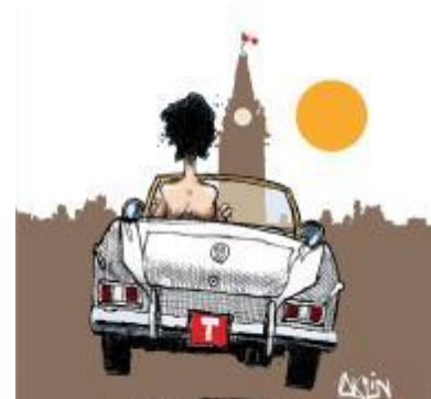
Justin Trudeau, Zoomer Magazine, décembre 2016. Don de Terry Mosher, M2016.28.21