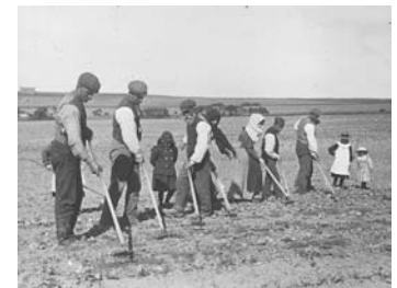
Famille occupée à sarcler, vers 1915

« Vers 1900, les jeunes gens d'une famille rurale du Québec devraient-ils tenter leur chance à Montréal, la plus grande ville du pays, ou partir pour les grandes étendues des Prairies, voire pour la Côte Ouest? »