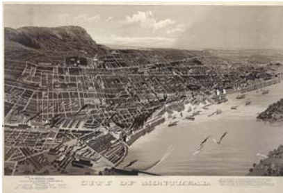
Ville de Montréal, 1888 M4824