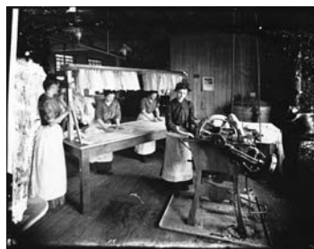
Femmes empesant des cols et poignets, vers 1901