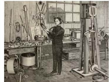
Un jeune ouvrier canadien, 1877