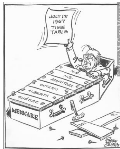
Les clous dans le cercueil