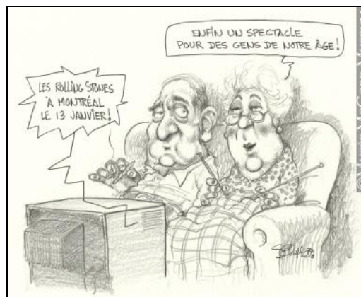
Les Rolling Stones à Montréal le 13 janvier!