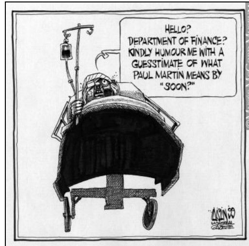
Un contribuable mal en point Aislin (alias Terry Mosher) 1999 M2003.109.33