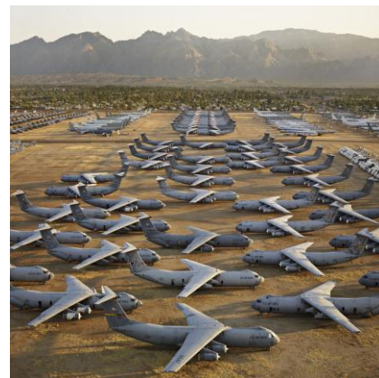
Edward Burtynsky, AMARC #5, Davis-Monthan AFB, Tucson, Arizona, USA, 2006. Chromogenic color print.

Le Musée McCord remercie de leur soutien le ministère de la Culture, des Communications et de la Condition féminine du Québec, le Conseil des arts de Montréal ainsi que ses partenaires : Astral, La Presse et The Gazette.