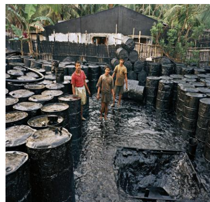
Edward Burtynsky, Recycling #2, Chittagong, Bangladesh, 2001. Chromogenic color print.