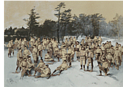
Le Red Cap Snow Shoe Club, Halifax, N.-É., 1888 William Notman/Eugène L'Africain © Musée McCord

La collection Notman est l'une des plus importantes collections de ce genre au Canada. Elle contient les archives photographiques du studio de Montréal, qui réunissent environ 450 000 photographies, dont 200 000 négatifs sur plaques de verre, des portraits, des paysages et des vues stéréoscopiques d'une valeur historique inestimable. La collection Notman renferme également 188 registres de photographies et 43 répertoires des clients du studio de Montréal, ainsi que 15 ouvrages publiés par William Notman, quelque 300 photos peintes, des photos composites, du matériel photographique et des documents, dont la correspondance de Notman avec sa famille demeurée en Écosse. Cette collection s'enrichit constamment grâce aux dons de particuliers, familles et collectionneurs, et constitue pour les chercheurs et les historiens une source inépuisable sur l'histoire de Montréal, de 1859 à 1935.