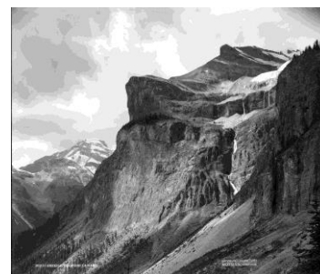
Emerald Peak et cascade, C.-B., 1904