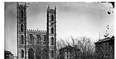
La place d'Armes et l'église Notre- Dame, Montréal, 1876