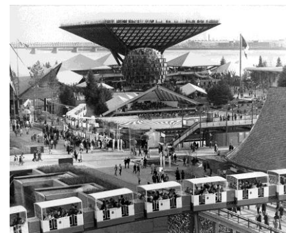
Vue du pavillon du Canada, Expo 67 1967