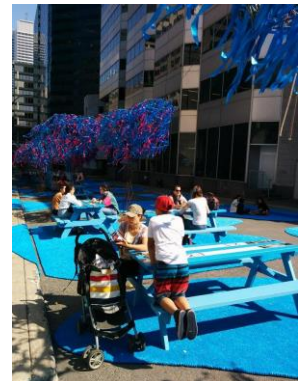
La Forêt urbaine 2015

Le Carrefour jeunesse-emploi Montréal Centre-Ville donne le coup d’envoi au Roulo-Boulo, le bus de l’emploi, à partir de La Forêt urbaine . Il s’agit d’une première pour ce minibus qui sillonnera le centre-ville cet été dans le but d’aider les jeunes en recherche d’emploi.