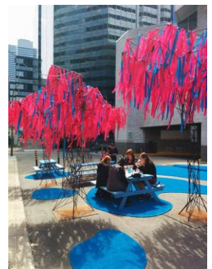
La Forêt urbaine 2015