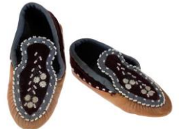
Mocassins Anonyme - 1865-1900