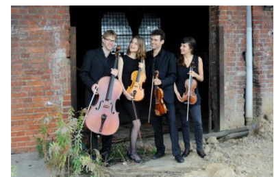
Musiciens de l'École Schulich