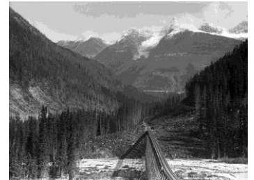
Wm Notman & Son/William McFarlane Notman, Boucle montrant quatre voies ferrées du Canadien Pacifique, C.-B., 1889 ©Musée McCord

Avec Gary Evans, professeur à l'Université d'Ottawa