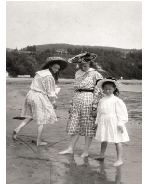
Trois jeunes filles de la famille Braithwaite, Tadoussac, Québec, 1905.

Le Musée McCord possède près d'une centaine d'albums composés par des photographes amateurs ayant capturé leurs souvenirs familiaux à l'aide d'un appareil de type Kodak. Consacrées aux enfants, aux amis, aux grands événements ou aux voyages, ces images de tous les jours sont souvent décrites comme étant candides, communes, ou même banales, mais elles sont pourtant riches de renseignements uniques. En mettant l'accent sur les snapshots sélectionnés pour l'exposition En Vacances! , la conférence, présentée par BMO Groupe financier, permet de mieux comprendre le potentiel documentaire de la photographie vernaculaire et rend compte des bouleversements ayant métamorphosé la société québécoise de 1900 à 1940.