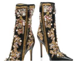
Dolce & Gabbana, bottillons en cuir avec broderie or, blanc et rose, 2001.

Expo 67 et la mode seront prétextes à transformer des vêtements qui serviront de toiles de fond à des images digitales ou encore à des textiles intelligents.