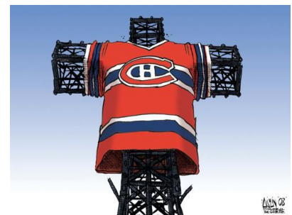
Aislin, Croix du mont Royal , The Gazette , 13 mars 2008. Don de Terry Mosher, © Musée McCord

L'exposition abordera la période de l'âge d'or des spectacles de magie et de ses mécanismes publicitaires et promotionnels qui misaient sur une imagerie fantasmagorique. Une sélection d'époustouflantes affiches, pour la plupart