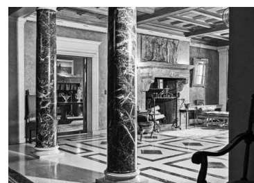
Charles Gurd 1475, avenue des Pins Ouest, Montréal - 1974

Dans les années 1910 à 1930, de célèbres hommes d'affaires montréalais comme Louis-Joseph Forget, entre autres, se firent ériger par les meilleurs architectes de l'époque de somptueuses résidences représentatives du style edwardien. Cette exposition témoigne d'un style et d'un art de vivre désormais révolus. Elle réunit quarante magnifiques photographies en noir et blanc, prises à la lumière naturelle, en 1974, par un jeune architecte et artiste photographe montréalais, Charles C. Gurd. Elles illustrent l'intérieur de ces maisons exceptionnelles, transformées ou disparues au fil du temps, avec l'évolution du mode de vie et des goûts des nouvelles générations.